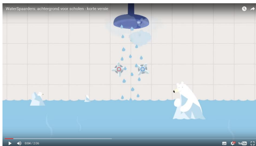
Waterspaarders op school

Scholen kunnen zich aanmelden via http://scholen.waterspaarders.nl/ . Op deze website kunt u ook meer informatie vinden.